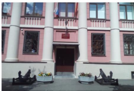
Рисунок 1 Было