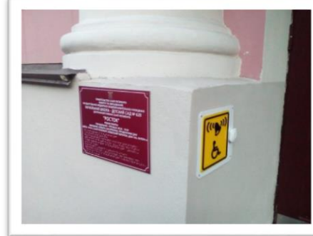
Рисунок 3 Стало 2