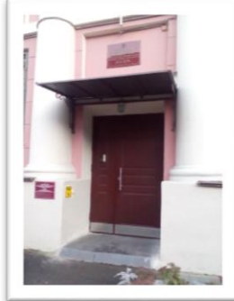
Рисунок 2 Стало 1